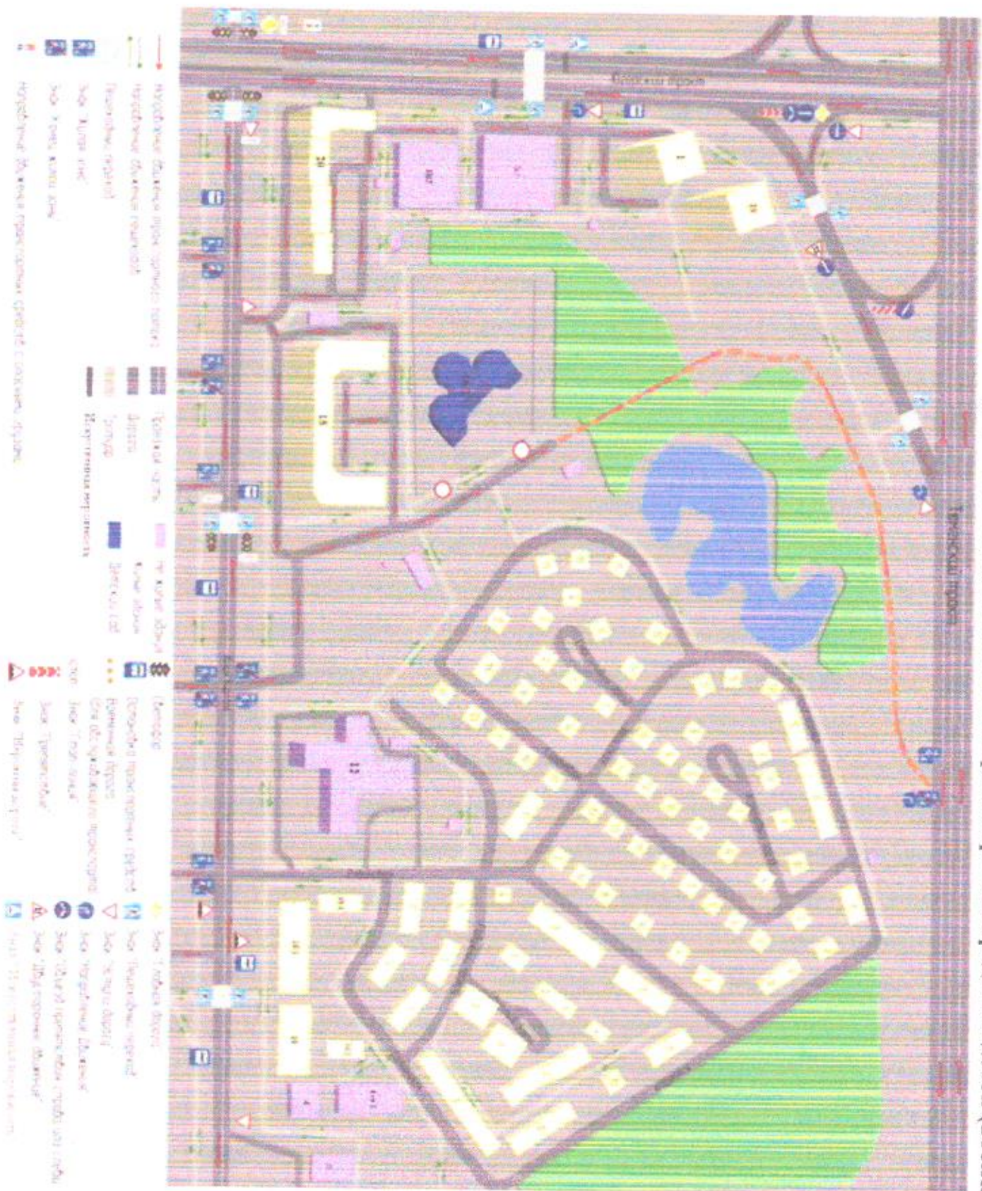
1. Район расположения образовательного учреждения, пути движения транспортных средств и детей (воспитанни